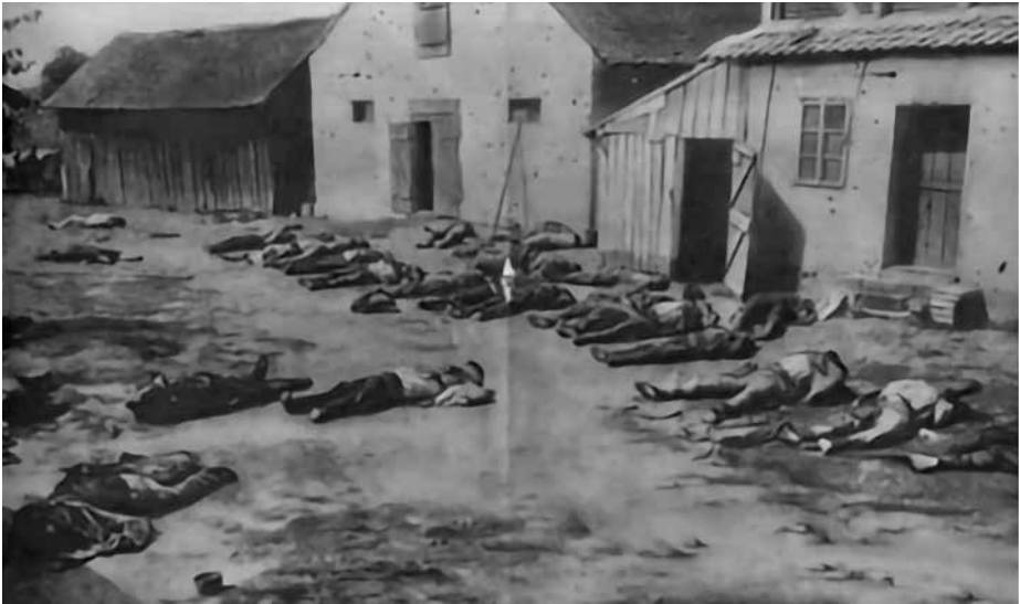
Аустроугари су заробили, а потом убили 27 Срба у Шапцу. Тела су пронађена у дворишту једног апотекара

којима су били заробљени, пуцајући на њих кроз прозорска окна. Нико, нажалост, није био поштеђен. Немилосрдно су пуцали на нејак народ који није никако могао да пружи отпор.