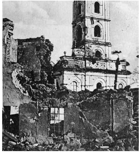
Артиљерија аустроугарске 2. армије и речни монитори разорили су Шабац августа 1914. године