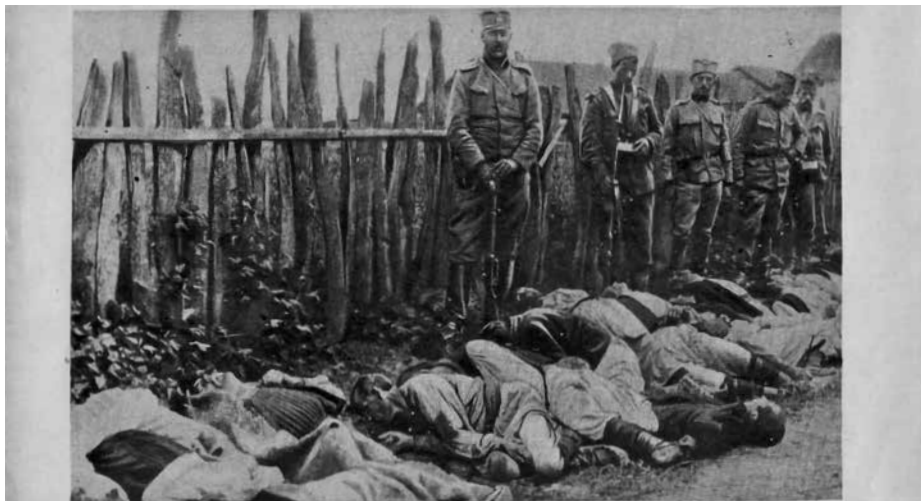
UN GROUPE DE PAYSANS MASSACRÉS DANS LE VILLAGE DE LOZNITZA

Жене страшно мучене потом убијене, поред Завлаке