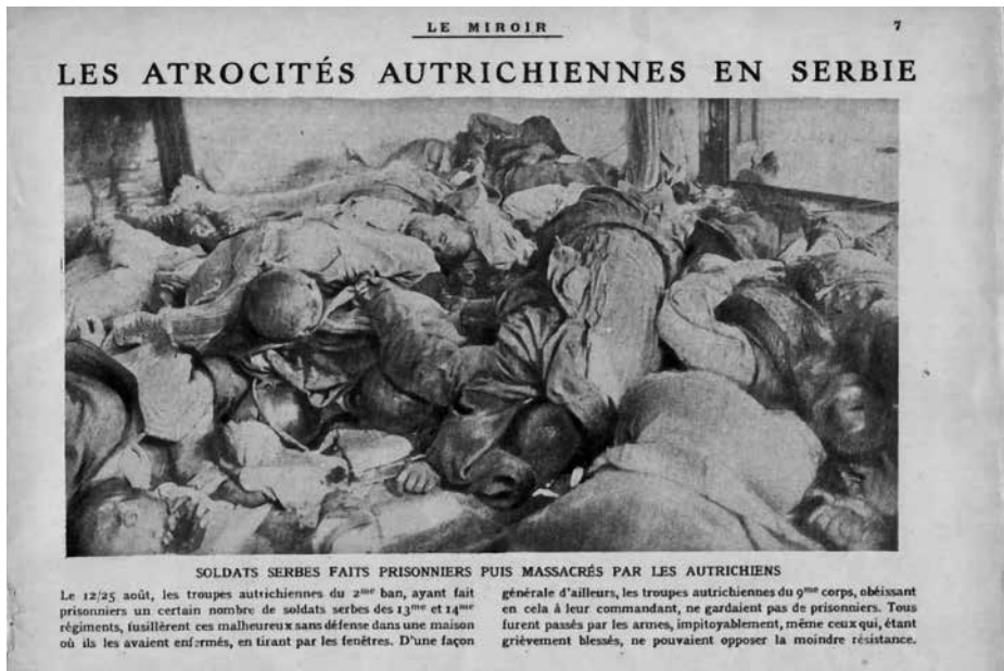
Заробљени српски војници масакрирани од стране Аустријанаца