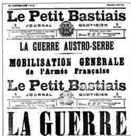
Насловна страна француског дневног листа „Мала Бастија” са Корзике и текстом под насловом „АУСТРО-СРПСКИ РАТ” и „Општа мобилизација француске војске”

Она је била заинтересована за Солун, излаз на Егејско море, али и за земље Балкана.