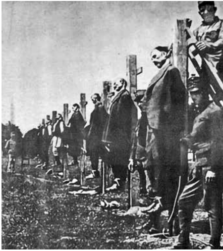
Жртве и џелати: Војска под заставом царевине искаљује бес на цивилима. Због ове слике је такође, на захтев Немачке амбасаде 1940. године, забрањена и спаљена књига под насловом „Београд“ од издавача „Балкански институт“ 1940. године.