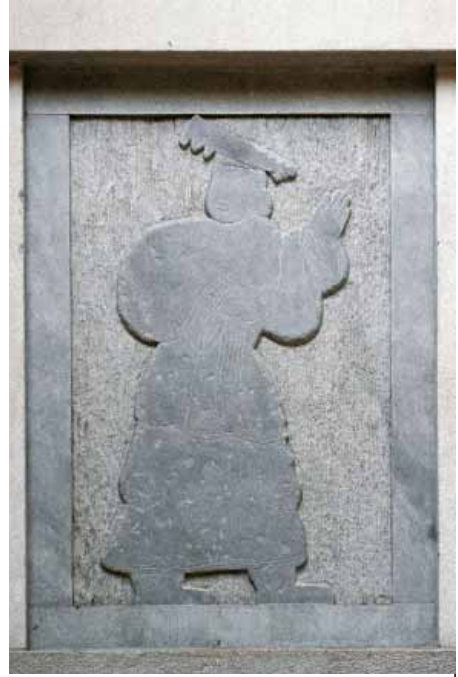
Kamena statua Žutog cara u Hali Sjuenjuan.