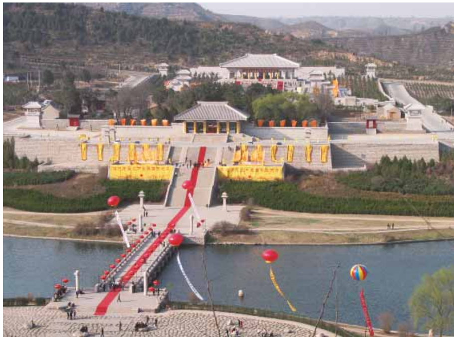
Hala Sjuenjuen, u pomen Žutom caru.

zime bilo Gungsun, i kaže se da je on bio vođa te porodice. Prema zapisima u kineskim istorijskim anama, nakon što je porazio cara države Jen, formirao je savez sa Jen carom i odbio invaziju devet plemena. Onda je preuzeo vođstvo saveza od Jen cara. Car Jen, kao Žuti car, poznat je u kineskoj legendi kao otac ili čak Bog poljoprivrede. On je stvorio poljoprivredu, konstruisao poljoprivredne alate, naučio ljude da seju i žanju, i uopšte izveo ljude iz doba lova i preveo u doba poljoprivrede. Žuti car bio je i bog medicine koji je koračao brdima skupljajući uzorke, i koji je otkrio koje biljke mogu da leče određene boljke. Zbog ovih eksperimenata je i sam bio sedamdeset dva puta ozbiljno bolestan. Kasnije je svoje obimno farmakološko znanje preneo ljudima napisavši knjigu u kojoj je zabeležio tri stotine šezdeset pet vrsta medicinskih biljaka. Žuti car ujedinio je sva plemena u Kini i izgradio svoju prestonicu u Sindžengu (neki stručnjaci veruju da je bila na drugom mestu po veličini). Proračunao je kalendar, razumeo