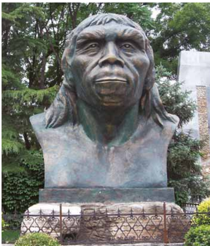
Statua Pekinškog čoveka-majmuna

Otkriveno početkom dvadesetog veka, nalazište Džoukoudijan blizu Pekinga ponudilo nam je izuzetno bogat fond fosilizovanih materijala ranih hominida koji su pronađeni zajedno sa obiljem botaničkih fosila. Intenzivnim proučavanjem ovih materijala dobili smo jasniju sliku ranog perioda čovečanstva, i na neki način smo u mogućnosti da slušamo daleke odjeke glasova naših predaka. Ovo