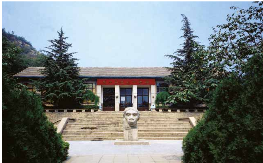
Muzej lokaliteta Džoukoudijan.

Fosil lobanje Pekinškog čoveka, izložen u Muzeju lokaliteta Džoukoudi- jan od 21. septembra 2003; Deo lobanje je čeona kost, otkrivena maja 1966. godine.