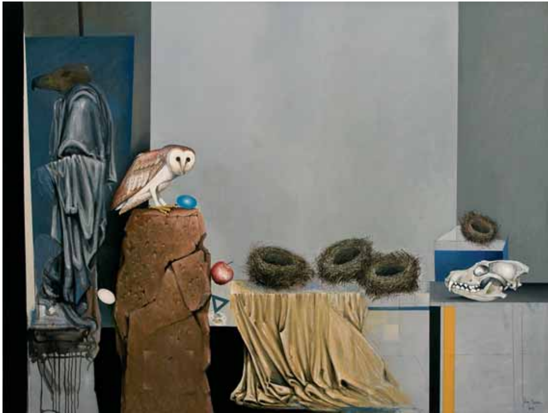
ЈАВОР РАШАЈСКИ, ПРАЗНА ГНЕЗДА , 2018.