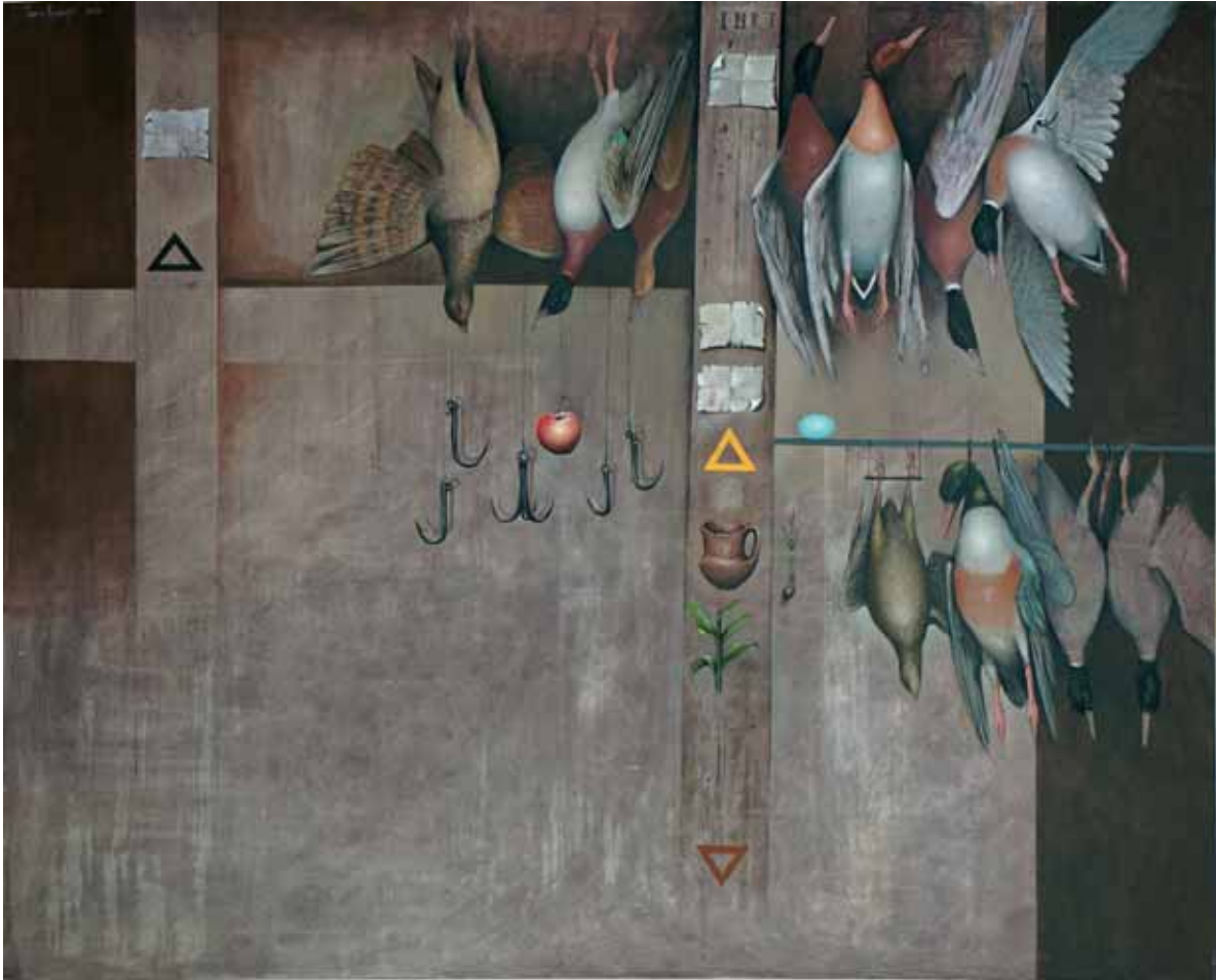
ЈАВОР РАШАЈСКИ, ЛОВАЧКА МРТВА ПРИРОДА, 2018.