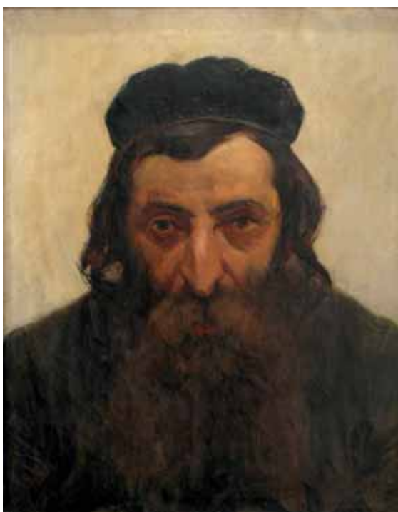
МИХАЉ МУНКАЧИ, СТУДИЈА РАБИНА , ДРУГА ПОЛ. XIX ВЕКА