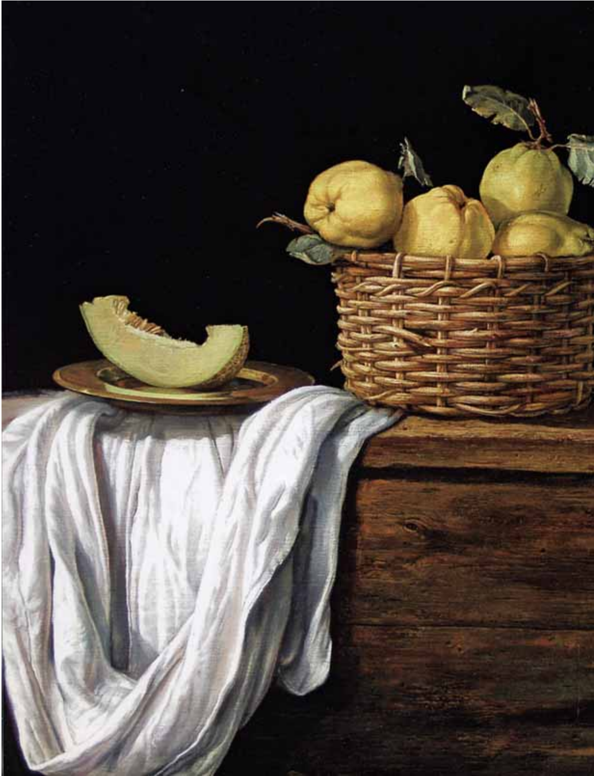
ЈАВОР РАШАЈСКИ, ШТА ЈЕ ИЗА ЗАВЕСЕ, ДЕТАЉ, 2018.