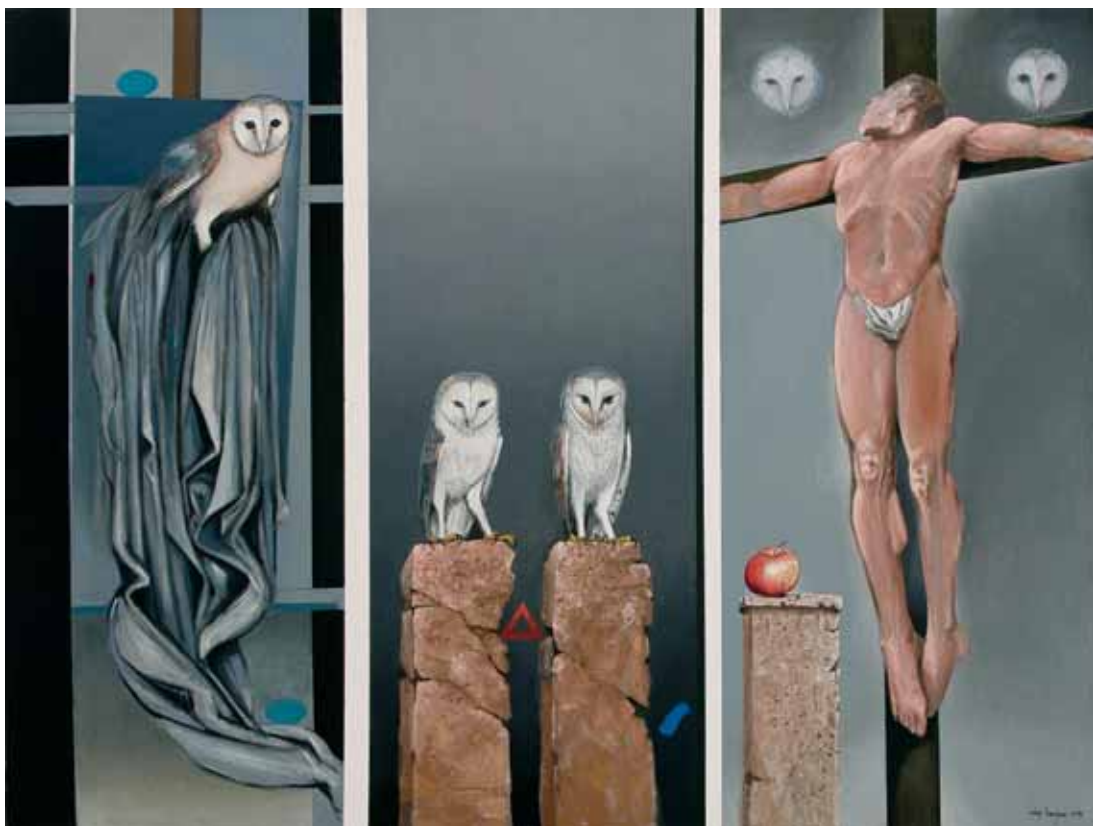
ЈАВОР РАШАЈСКИ, РАСПЕЋЕ , 2014.