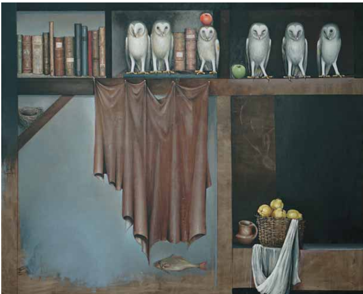
ЈАВОР РАШАЈСКИ, ШТА ЈЕ ИЗА ЗАВЕСЕ , 2018.