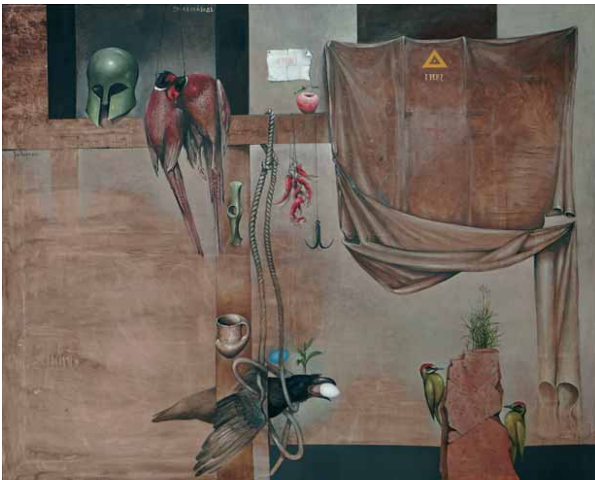
ЈАВОР РАШАЈСКИ, ГАВРАНОВ ЛЕТ, 2019.