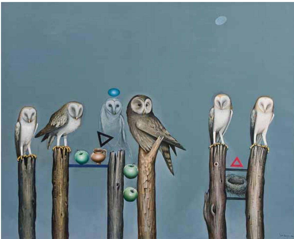
ЈАВОР РАШАЈСКИ, СОВЕ И ПРАЗНА ГНЕЗДА , 2019.