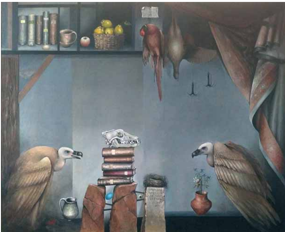
ЈАВОР РАШАЈСКИ, СУПОВИ, 2023.