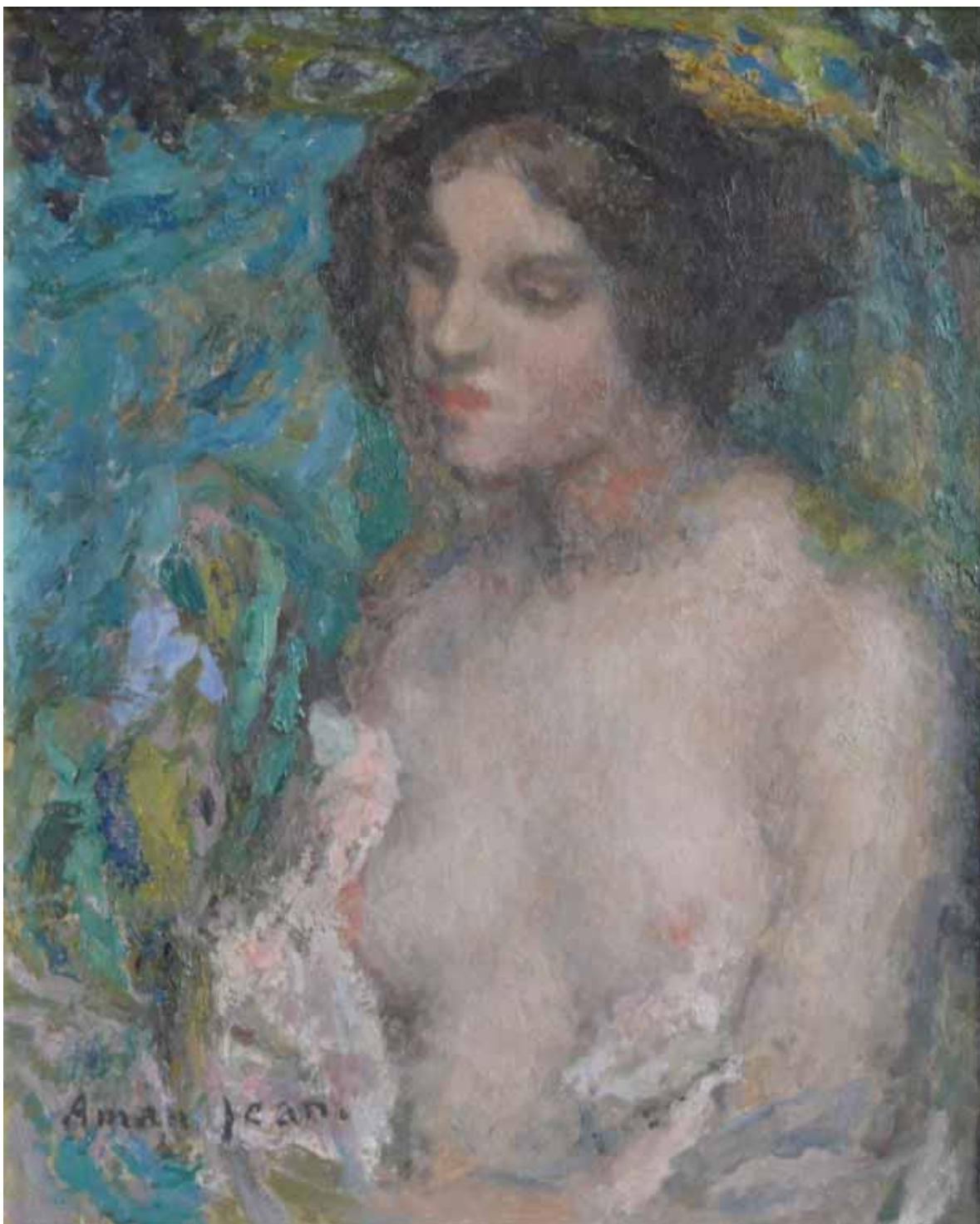
ЕДМОНД – ФРАНСИС АМАН – ЖАН, ПОЛУАКТ ЖЕНЕ, КРАЈ XIX ВЕКА