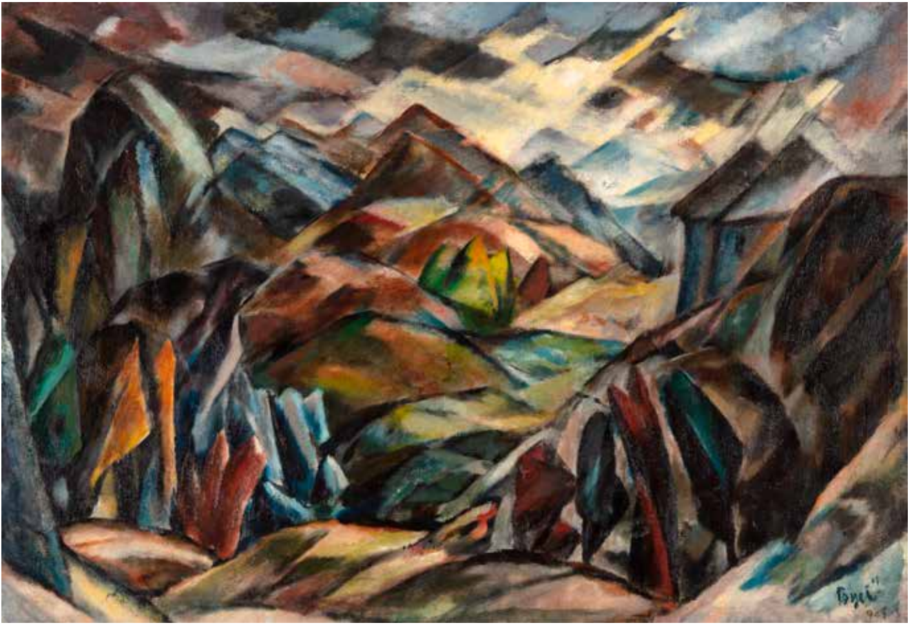
ЈОВАН БИЈЕЛИЋ, ПРЕДЕО ИЗ БОСНЕ , 1921.