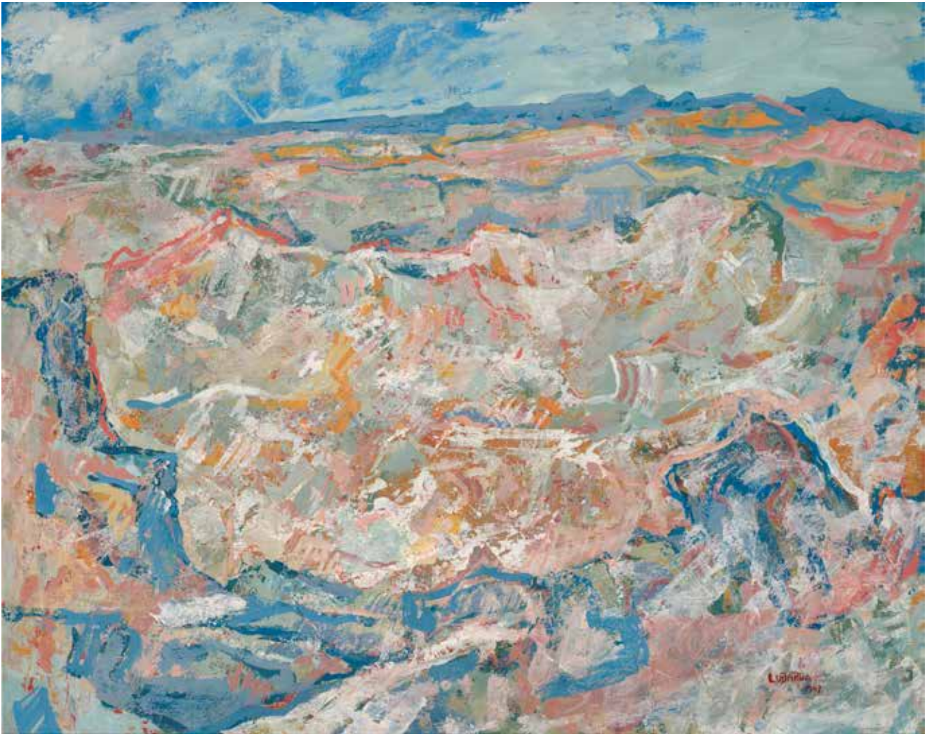
ПЕТАР ЛУБАРДА, КАМЕНА ПУЧИНА , 1947.

је намах јасно да пред собом истински острашћеног, љубопитљивог и крајње радозналост заљубљеника у оно што скупља. Касније сам се уверио да он своја колекционрска искуства и своје непатворену љубав према ликовном стваралаштви покушава да пренесе и младим спортистима чије је био и јесте учитељ у сваком погледу.