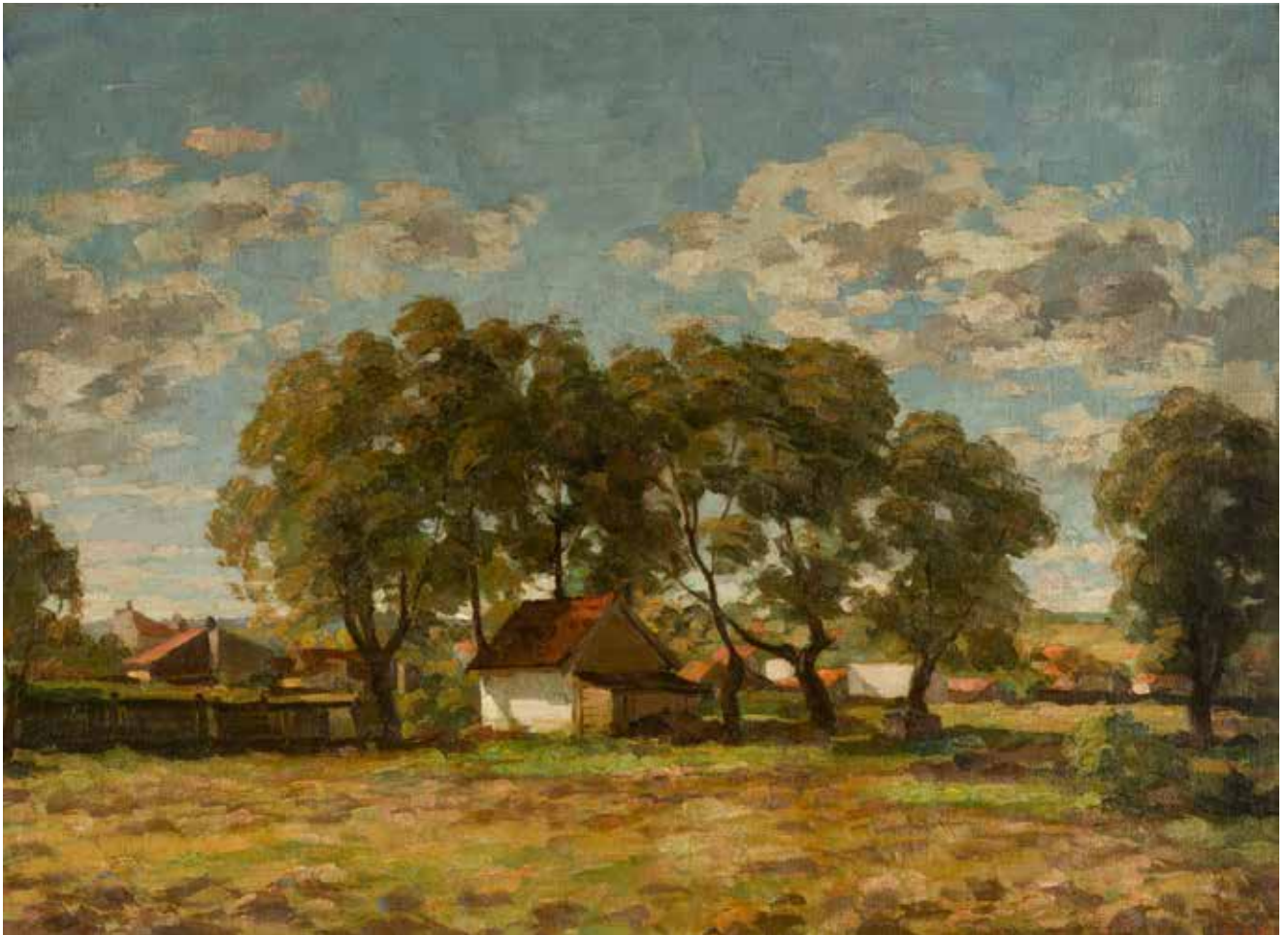
БОРИВОЈЕ СТЕВАНОВИЋ, МОТИВ ИЗ ПРЕДГРАБА , 1938.