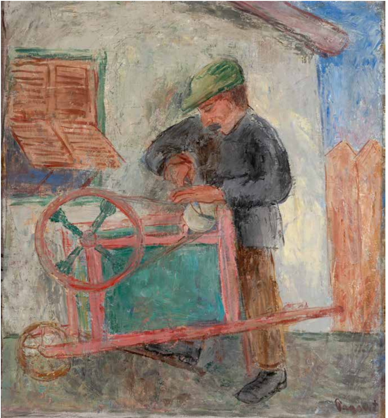
ИВАН РАДОВИЋ, ОШТРАЧ , ОКО 1925.