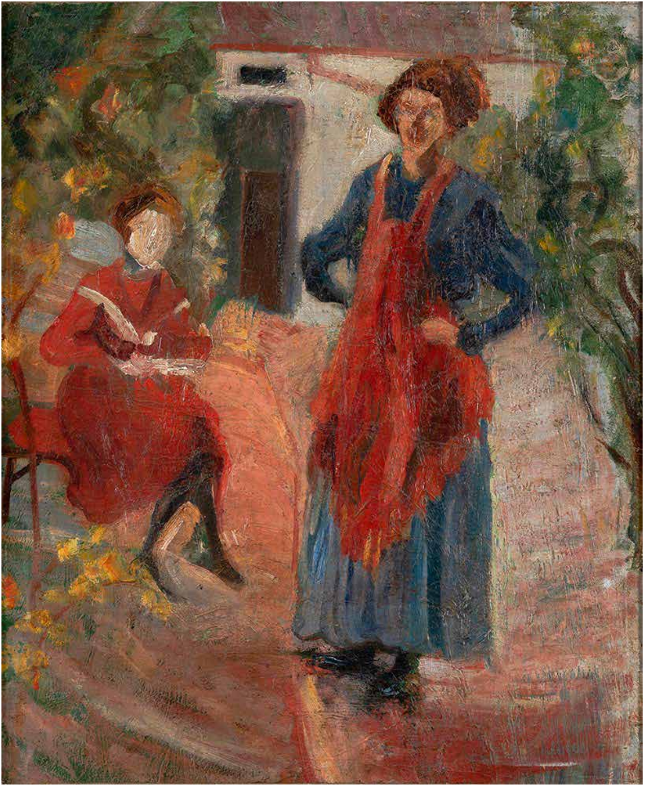
НАДЕЖДА ПЕТРОВИЋ, ДВЕ СЕСТРЕ , ОКО 1907.