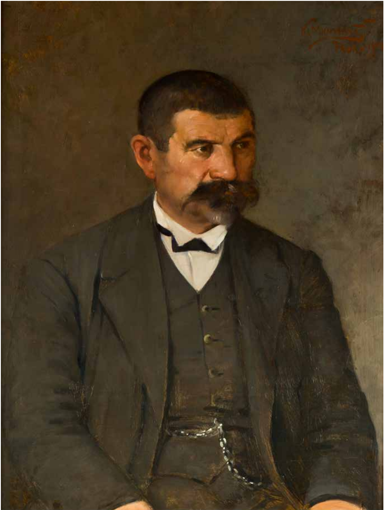
КОСТА МИЛИЧЕВИЋ, ПОРТРЕТ МУШКАРЦА СА БРКОВИМА, 1909.